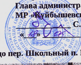
Схема движения автотранспорта по проезду к Бетлицкой школе от ул. Калинина до пер. Школьный п. Бетлица