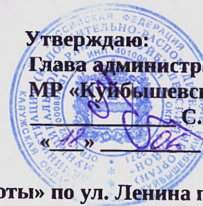
Схема ограничения движения автотранспорта по площади «Героям Безымянной высоты» по ул. Ленина п. Бетлица